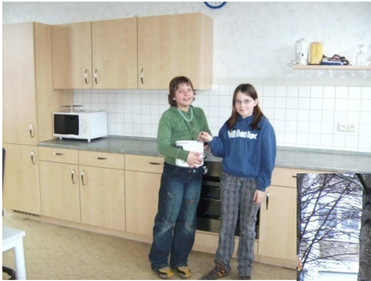
Unsere neue Projektküche

Jede Klasse hat jetzt einen eigenen Computerarbeitsplatz